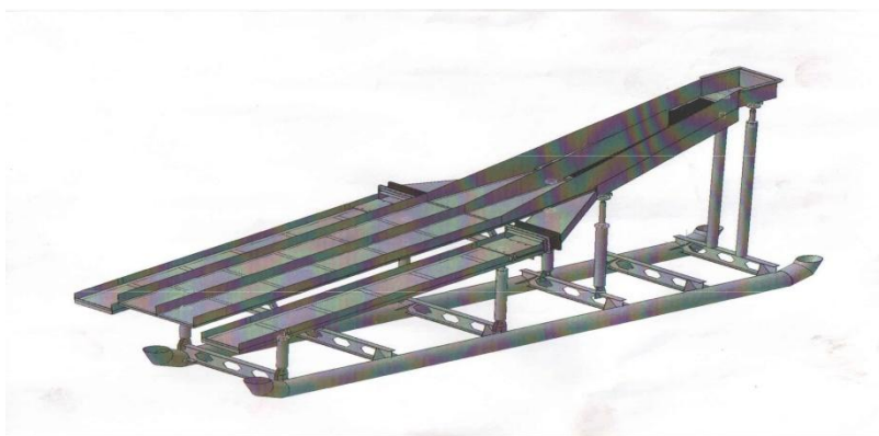
На рисунке изображен шлюзовой комплекс РПШК-30м 2

950 тыс. до 1,2 миллиона рублей в зависимости от комплектации. Насосная станция поставляется по отдельному договору.