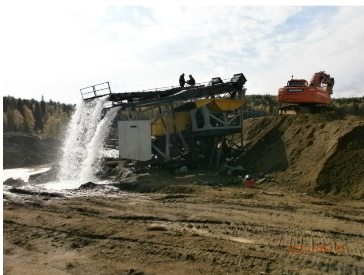
СПЗК-60 самоходный комплекс на базе скруббер-бутары 100 м 3 /ч показанной ниже